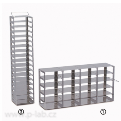
Stojan do mrazících boxů