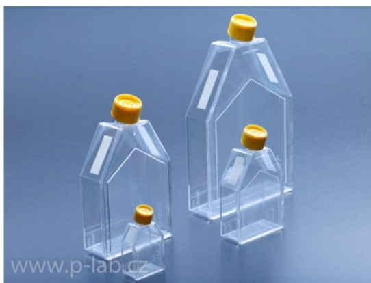
Lahvička kultivační s odtrhávací fólií a filtrem ve víčku