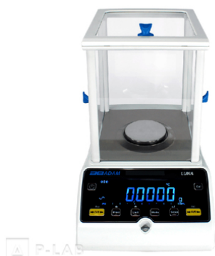
Váhy analytické Luna