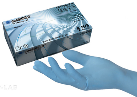
Ruka a krabice duoSHIELD™ PFT Nitrile modré 240