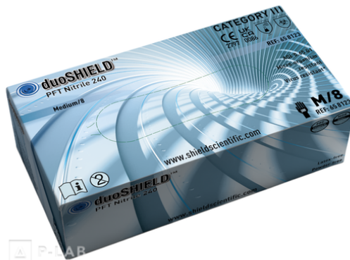
Krabice rukavic duoSHIELD™ PFT Nitrile modré 240