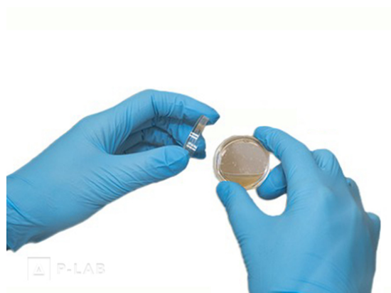
Rukavice duoSHIELD™ PFT Nitrile modré 240