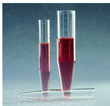
Zkumavky centrifugační z PC