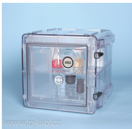
SECADOR 2.0 čirý