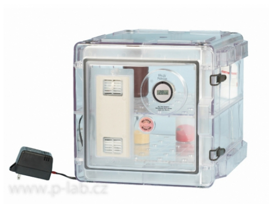
SECADOR 2.0 A čirý