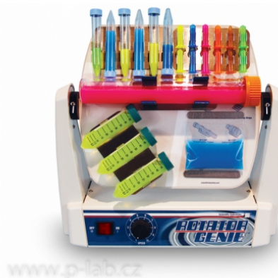
SI-2200 s magnetickou plošinou