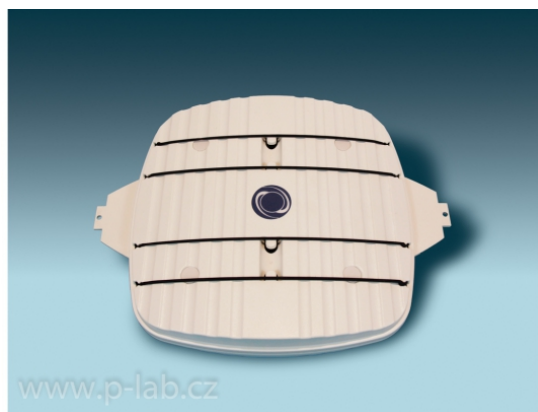
Standardní plošina s gumovými úchyty