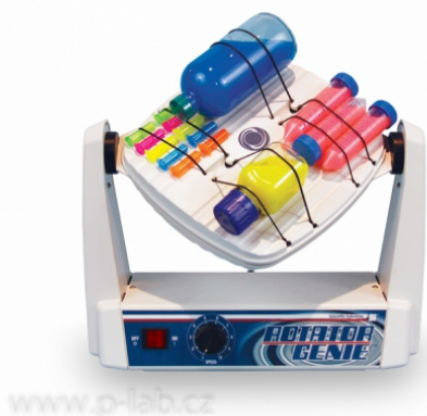
SI-2100 se standardní plošinou