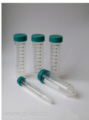
Zkumavka centrifugační se šroubovacím víčkem