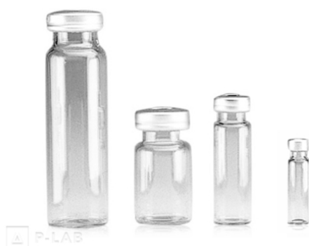
Číré pertlovací vialky

Materiál: borosilikátové sklo 1. hydrolytické třídy