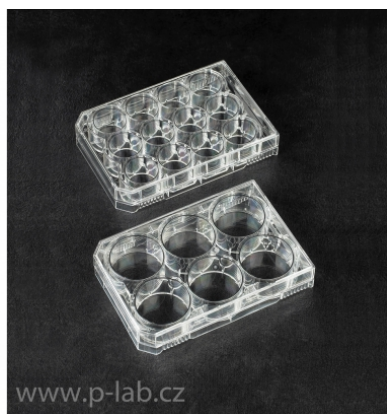
Kultivační destičky pro tkáňové kultury