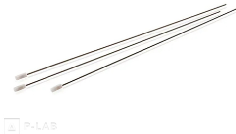
Písty s PTFE těsněním