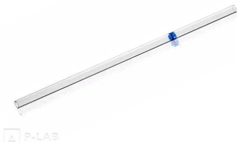
Skleněná kapilára pro objem 20 - 100 \mu\text{l}

*Kapiláry pro 100 \mu\text{l} (modré značení) jsou balené po 50 ks