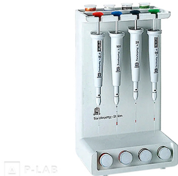
Stojánek na 4 mikropipety Transferpettor 1 - 200 \mu l