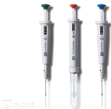
Pipety "positive displacement" Transferpettor