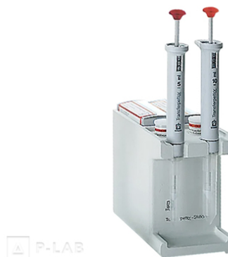
Stojánek na 2 makro pipety Transferpettor 0,5 - 10 ml