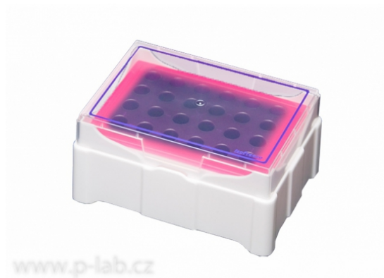
Krabička chladicí IsoFreeze MCT fialová - růžová