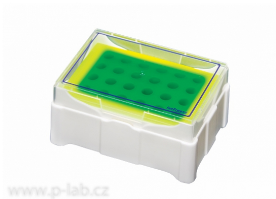
Krabička chladicí IsoFreeze MCT zelená - žlutá