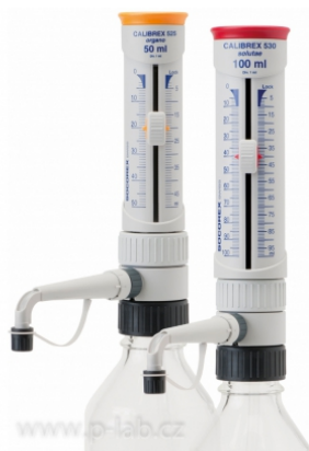
Dávkovač Calibrex 525 a 530