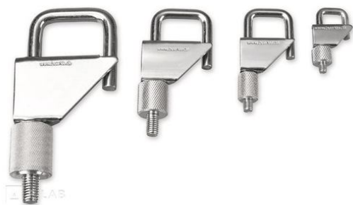
Svorka hadičková kovová

Materiál: pozinkovaná ocel, hliníková matice