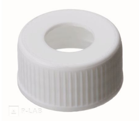
Víčko s otvorem