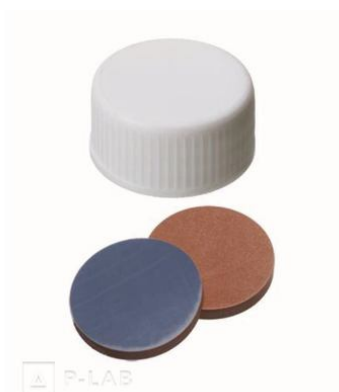
Víčko bez otvoru se septem - červený butyl / šedý PTFE