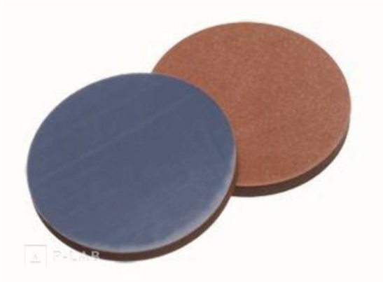
Septum - červený butyl / šedý PTFE