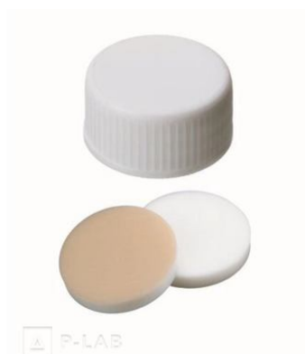
Víčko bez otvoru se septem - přírodní silikon / běžový PTFE