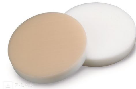
Septum - přírodní silikon / běžový PTFE