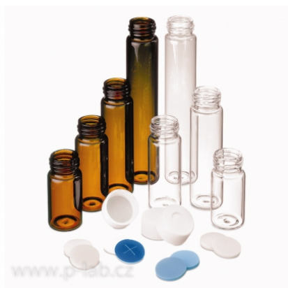
Vialka šroubovací ND24 (EPA)

Materiál lahvičky: borosilikátové sklo 1. hydrolytické třídy