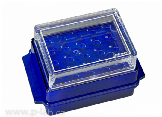
Krabička chladicí oboustranná IsoFreeze modrá