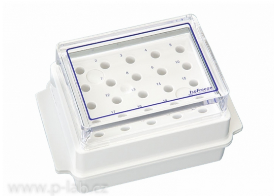
Krabička chladicí oboustranná IsoFreeze bílá