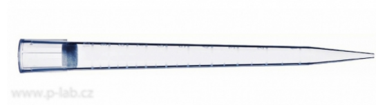
Špička 10 ml U453100