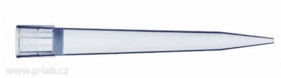
Špička 10 ml U452100