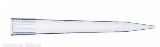
Špičky 5 ml