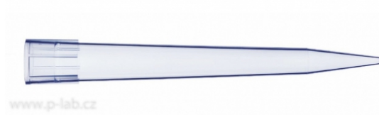
Špička 10 ml U452000