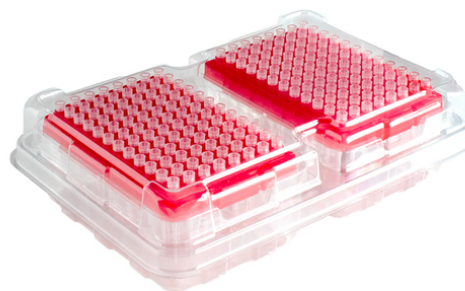
Špičky 10 µl s filtrem EcoPack® 2 x 96/refill