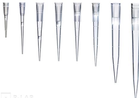
Špičky micro s filtrem Vertex® NoStick