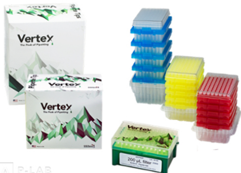
Špičky micro s filtrem Vertex™ NoStick