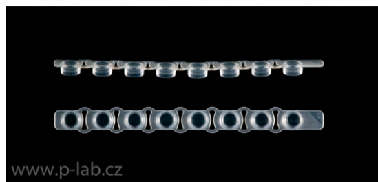
Strip 8 čirých plochých víček