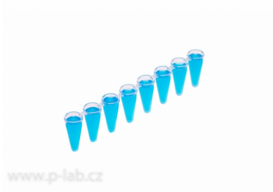
Strip 8 "low profile" PCR mikrozkuvek