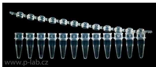
Strip 12 standardních mikrozkumavek a vydutých váček