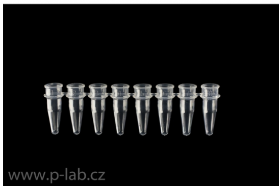
Strip 8 čirých PCR mikrozkuvek