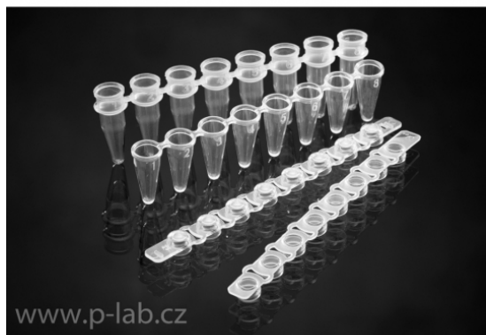
Strip 8 standardních a "low profile" mikrozkumavek a vydutá a plochá víčka