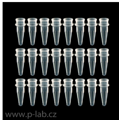
Stripy 8 čirých PCR mikrozkuvek