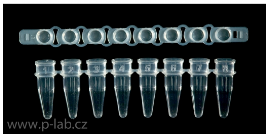
PCR mikrozkušavky tenkostěnné v proužku bez víček