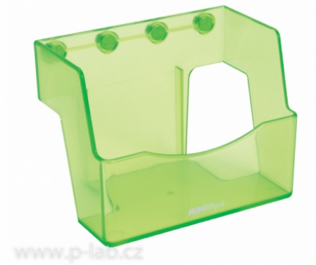
Box na laboratorní ubrousky