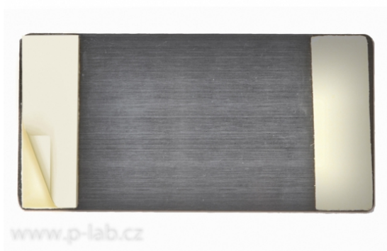
Zadní strana kovové destičky