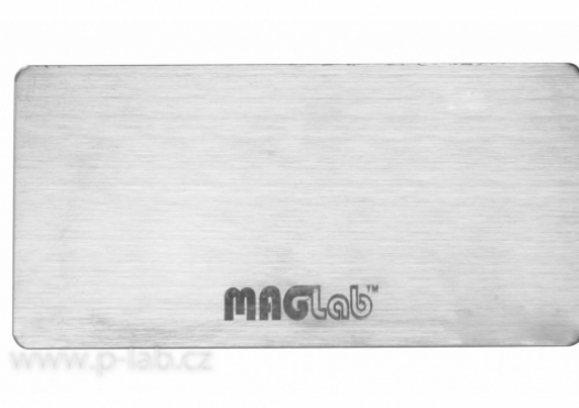
Kovová destička pro nekovové povrchy