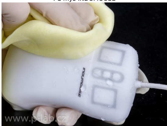
PC myš INDUMOUSE