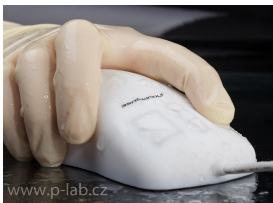
PC myš INDUMOUSE