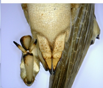
Princip použití funkce EDOF