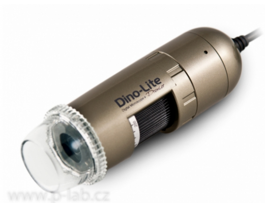
Mikroskop univerzální AM4113ZT