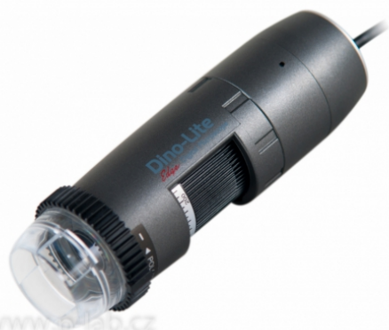
Mikroskop univerzální AM4515ZT