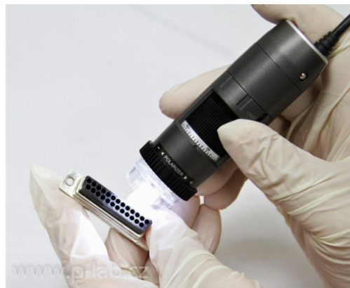
Mikroskop univerzální AM4815ZT