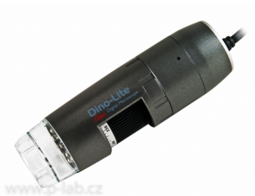
Mikroskop univerzální AM4115T