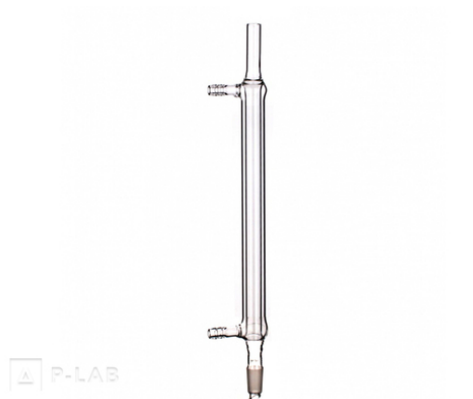
Chladič rovný dle Liebiga se zábrusem dole