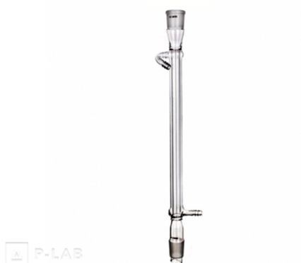
Chladič rovný dle Liebiga dva zábrusy