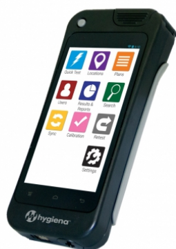
Luminometr EnSURE Touch™

Startovací balíček S1 obsahuje Luminometr EnSURE Touch a 2x Ultrasnap/Aquasnap. Startovací balíček S2 obsahuje Luminometr EnSURE Touch a 2x Supersnap.